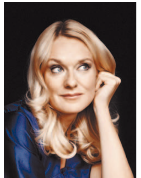
Největší hvězdou Svatováclavského hudebního festivalu je Magdalena Kožená.