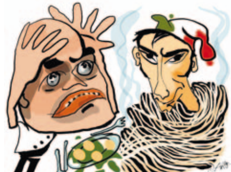
Karikatura známých televizních kuchařů Zdeňka Pohlreicha a Emanuela Ridiho.

Mám rád takový prostý a obyčejný pohled na danou záležitost. Preferuji místa s určitým sociálním rozměrem. K fotografování se snažím přistupovat reportážně, jako bych u toho dění vůbec nebyl. Následně ani fotografie neupravuji pomocí nějakých technických excesů, mám rád takzvanou čistou fotku. (peb)